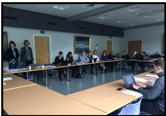
Møde i Dansk ReumaBiobank den 31. oktober