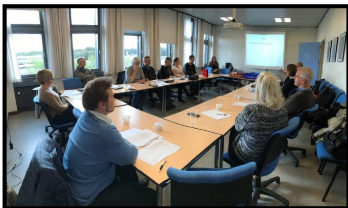
Møde i Dansk CancerBiobank den 26. oktober

Dansk CancerBiobank og Dansk ReumaBiobank har holdt faglig følgegruppe møder med konstruktive diskussioner og mange nye spændende tiltag.